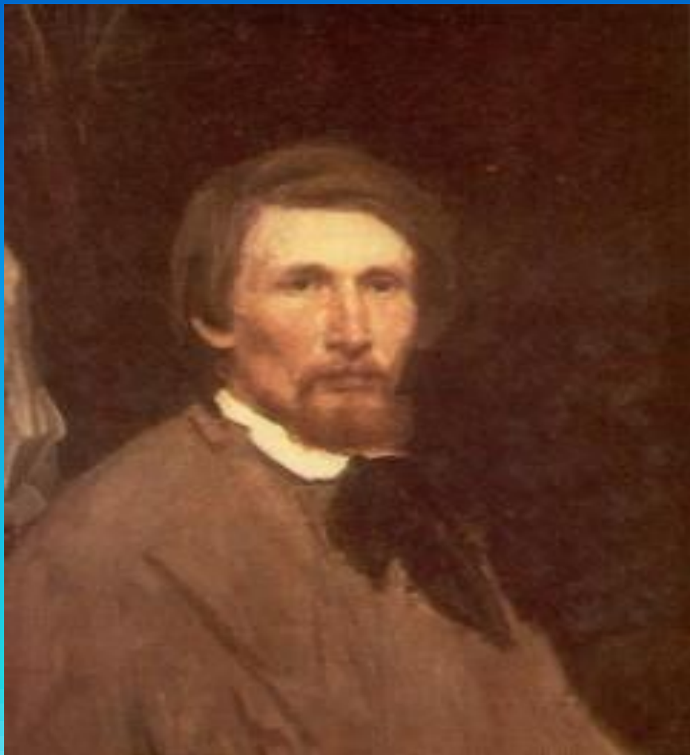
Виктор Михайлович Васнецов (1848-1926)