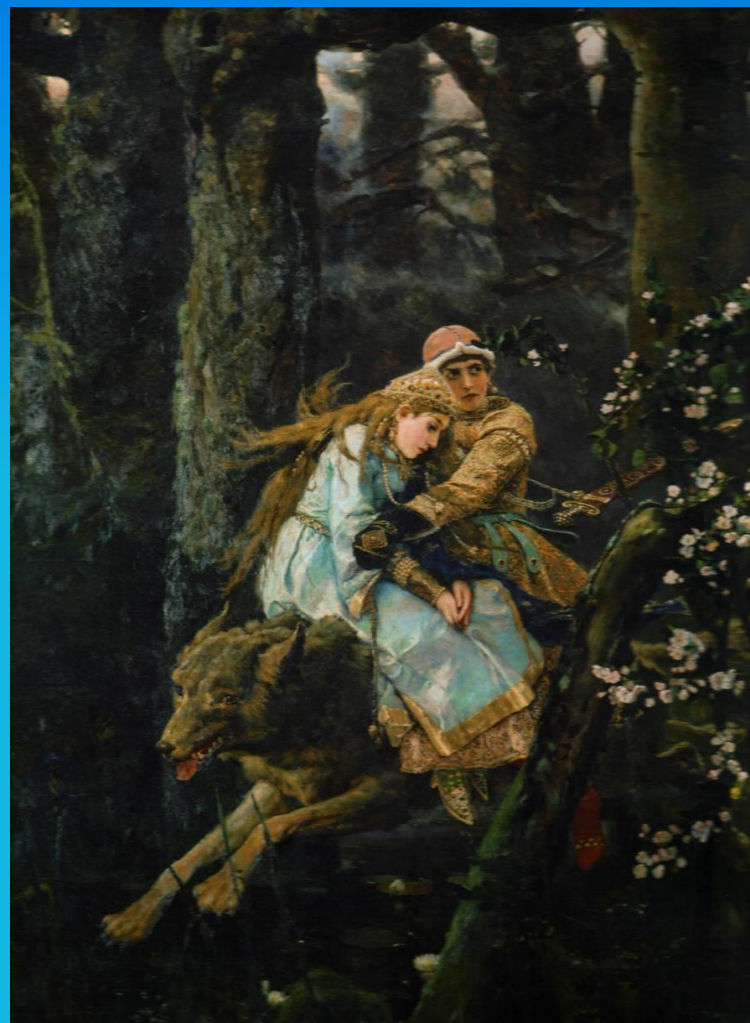
«Иван Царевич на сером волке»