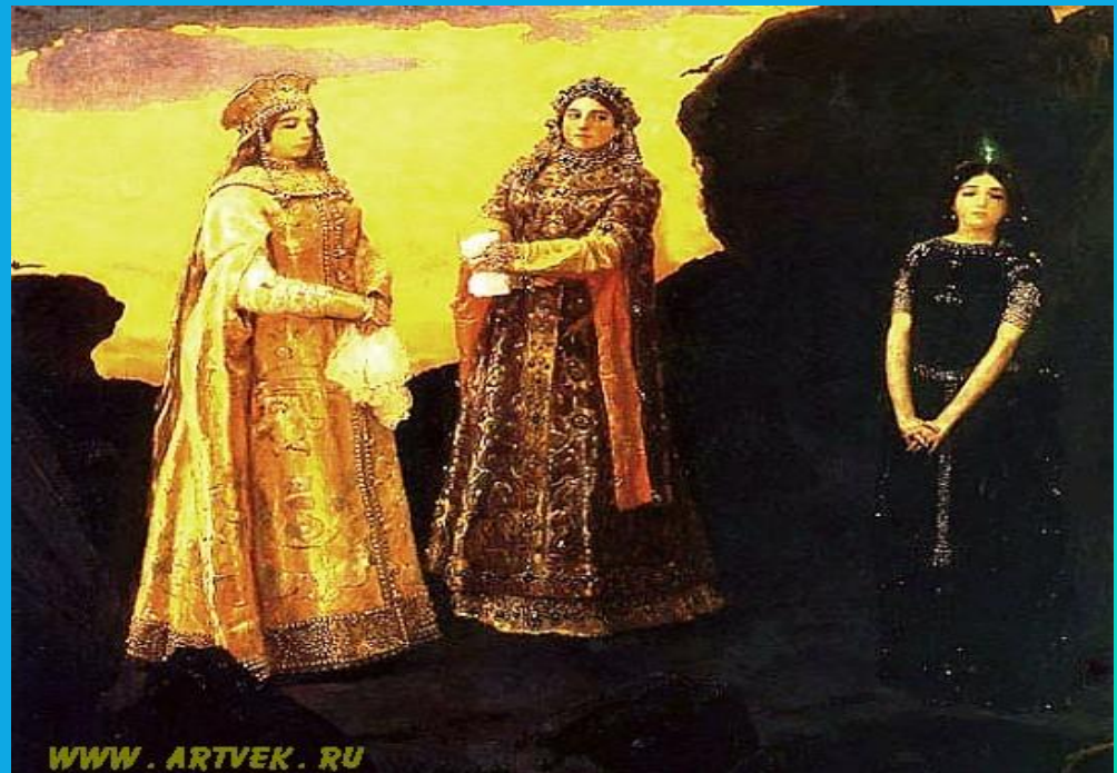
«Три царевны Тёмного царства»