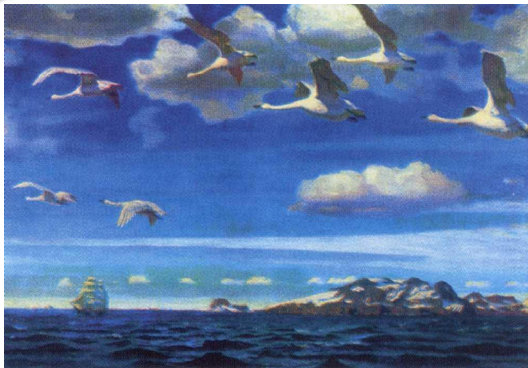
«В голубом просторе»