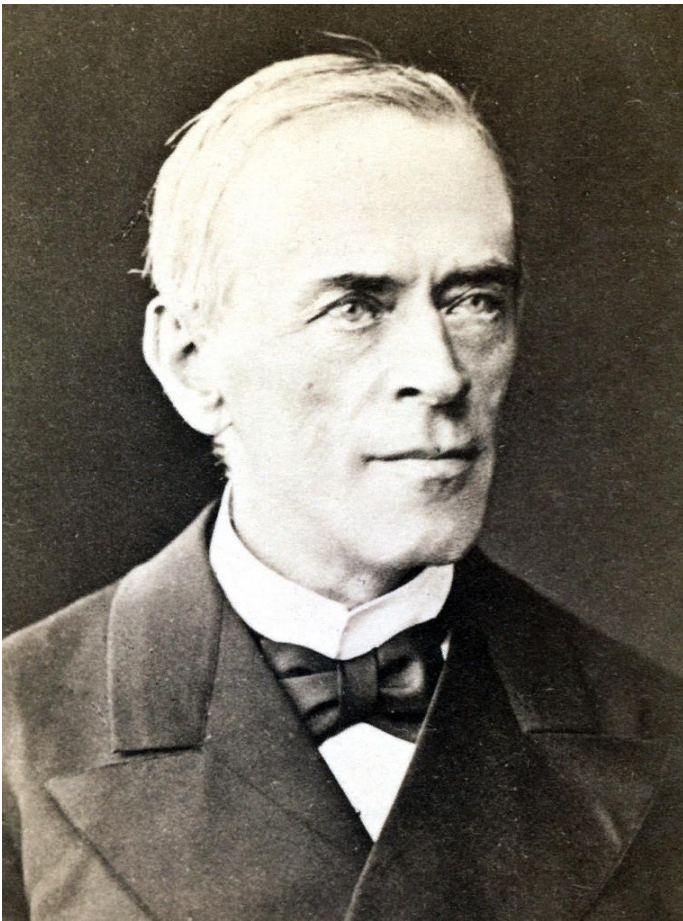
Николай Христианович Бунге. Фотография 1880-х гг.