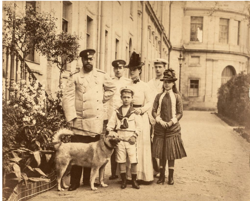
Александр III с семьей в Гатчине, Фото 1886г.