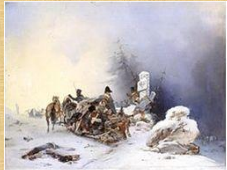
Бегство французов Из России. Виллевальде (1846)