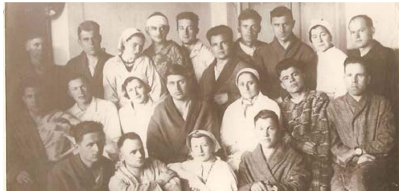
В кабинете лечебной физкультуры (спортивный зал школы)

Саратов служил надежной преградой от инфекций и целого ряда осложнений, характерных для свежих ранений, первичных и вторичных кровотечений, необработанных ранений грудной клетки, осложненных ранений головы. В эвакогос-