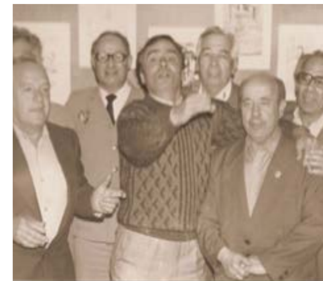
На встрече звучали испанские песни

Прошел год, как мы встретились в вашей прекрасной, гостеприимной школе. Короткие часы, проведенные среди вас, были для меня очень радостные и интересные. Ведь город Саратов для меня один из любимых и запоминаемых городов. Так как я в нем прожил три нелегких года... Что нам, таким ребятам как вы сегодня, пришлось пережить вдали от родных и близких, вам понять сложно. В этой школе я жил (не учился, а жил) 6 месяцев (с декабря 1941 г. по июнь 1942 года), так что можете представить мои ощущения, когда я переступил порог вашей гостеприимной школы после 47 лет» [4].