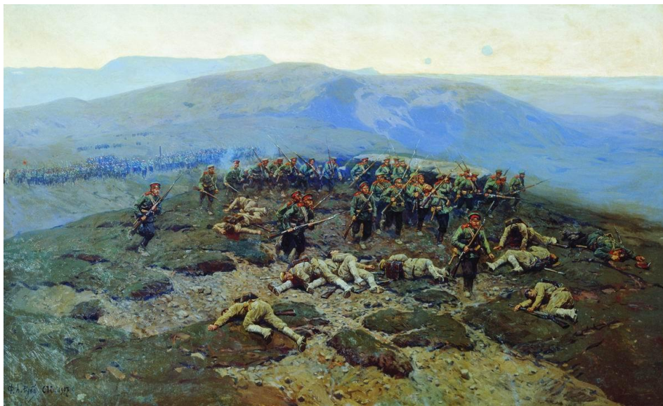
Художник Ф. Рубо «Атака Новочеркасского полка в бою на реке Шахе»