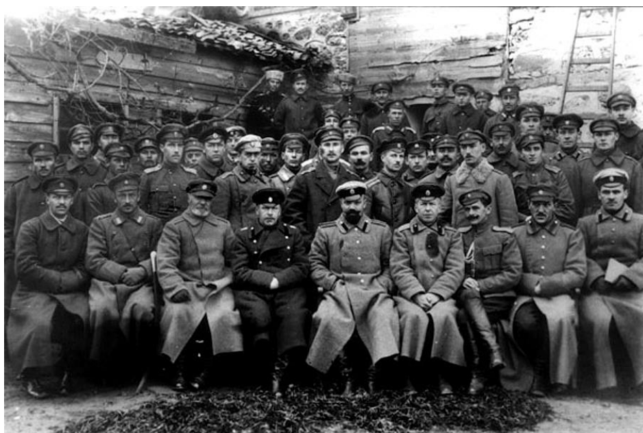
Командование и штаб 1-го Армейского корпуса перед отъездом из Галлиполи, 15.12.1921 г.

С 1 января 1920 г. непрерывно находился при А.П. Кутепове в штабе управления 1-го армейского корпуса в Галлиполи. Являлся одним из 18 учредителей Общества Галлиполийцев, подписавших Устав Общества 22 ноября 1921 года, член временного Совета Общества Галлиполийцев [14-16].