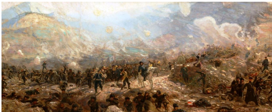
Ю. И. Репин «Тюренчен. В славной смерти вечная жизнь» (11-й Восточно-Сибирский стрелковый полк в Тюренченском бою)

Силы японцев составляли около 45 тыс. человек против 18 тыс. у русских, которые были вдобавок распределены по всему фронту Ялу вдоль позиций на правых берегах рек Ялу и Эйхэ. В месте фактического боя — у Тюренчена — японцы имели пятикратный численный перевес [10].