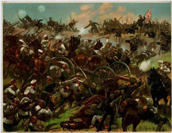
Художник Фриц Нейман (1881—1919) «Битва под Ляояном»

Численность Маньчжурской армии русских под Ляояном составляла 128 тысяч штыков, 606 орудий. Маньчжурской армии противостояли 1-я, 2-я и 4-я японские армии (всего 126 тысяч штыков, 484 орудия) [2].