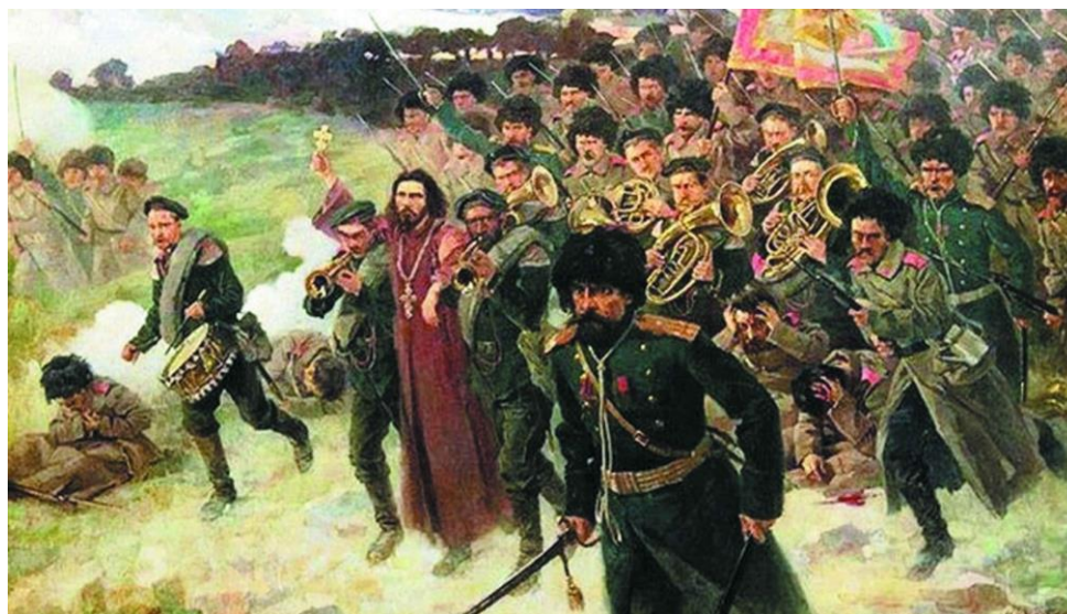
Художник Моисей Маймон «Полковой священник Стефан Щербаковский в бою под Тюренченом» (1904)

11-й Восточно-Сибирский стрелковый полк был выдвинут из резерва для прикрытия отступления, но вскоре оказался в окружении, из которого вышел с большими потерями. Несколько раз полк ходил в штыковую атаку, но японцы, не принимая удара, отходили и расстреливали русские войска ружейным огнем. В одной из атак погиб командир полка полковник Н. А. Лайминг, был ранен полковой священник С.Щербаковский, полк потерял около половины своего состава.